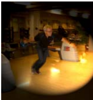
Sverre mitt i svingen...

Bowlarna träffas varje tisdag klockan 12 på Bellewuehallen. Just nu är vi 14 stycken som varje tisdag tränar för att hitta det mest perfekta slaget.