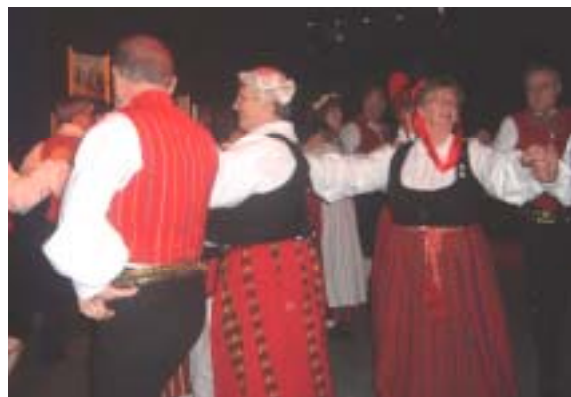
Folkdansarna i "Herman o Mina"