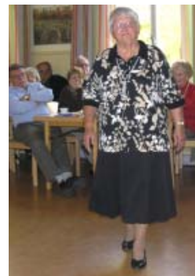
Lilli i elegant kreation