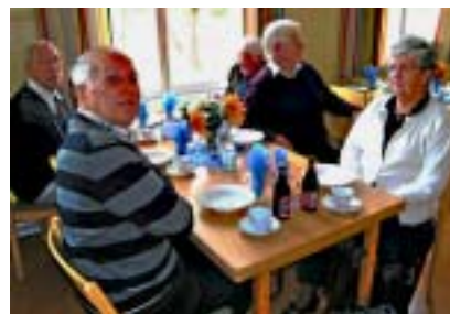
I väntan på soppa