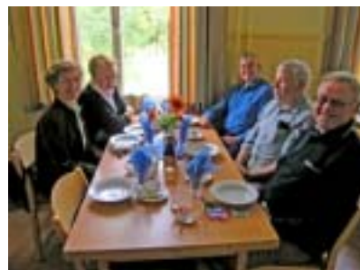
Stämningen var hög