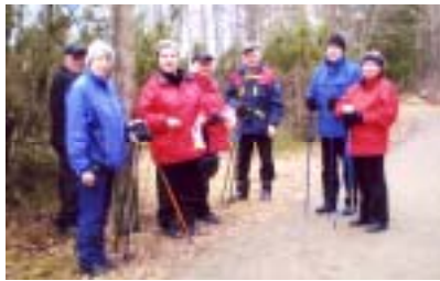
”Gänget på gång”

i föreningen har varit flitiga stavgångare under hela vårsäsongen, och vi fortsätter att gå så länge benen och skorna håller. Vi har varit 8 stycken som gått en runda i Önstasparet varje måndag kl 9.30. Vi har ingen flåsteknik, alla går i sin egen takt. Vi pratar, skrattar och har trevligt tillsammans. Det vore trevligt om flera kunde delta. Ryktet säger att det skylles på att man inte vill ta bilen, men den ursäkten duger inte. Vi är många som kör bil och det finns nånting som heter samåkning Tänk på det och kom med! Hälsar en i gruppen