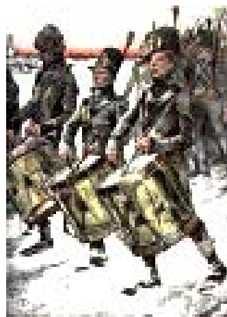
Bilden är ur Fänrik Ståls Sägner och Björneborgarnars marsch.