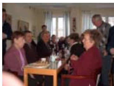
Livligt "surr" i väntan på soppan

I årsmötet deltog 49 medlemmar vilket är mycket glädjande, med tanke på kollisionen av OS-finalen i ishockey. Århundredets match, mellan Tre Kronor och Lejonerna!