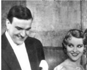
Ernst o Tutta Rolf