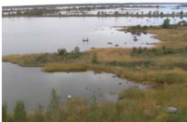
Kvarkens världsarvs moränkärgård.