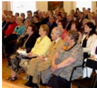
Delar av publiken

Efter konserten förflyttade vi oss till Tegnér matsalen för en bit mat. Vår festen kan du läsa om på nästa sida.