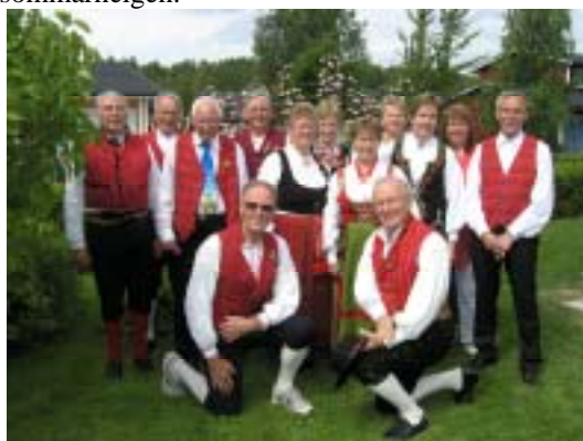
Gänget som fixade årets uppvisningar.

Dansgruppen har "semester" efter våravslutning och traditionell midsommardansuppvisning. Vi dansade för tacksam publik på fyra äldreboenden under midsommarhelgen.